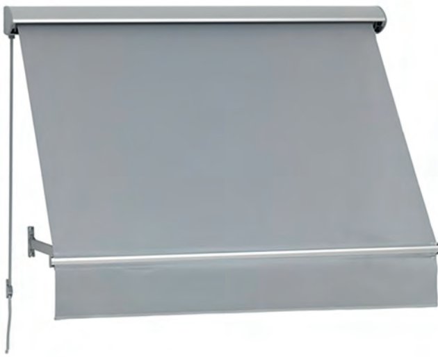
Nauhakäyttöinen ikkunamarkiisi koteloituna